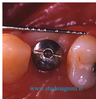
Ottima guarigione dei tessuti periimplantari

Avvenuta la guarigione del sito post estrattivo, vista la completa integrità degli elementi dentari adiacenti, si decide di procedere al posizionamento di un impianto eseguendo in anestesia locale un mini rialzo del seno mascellare per rigenerare la quota d'osso necessaria per una buona stabilità implantare.